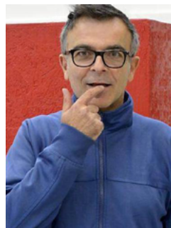
Maison Quinta Vendredi 21 juin à 19h30 Discussion publique et signature

En association avec l'écrivain, poète et critique d'art Pierre Giquel, il publie en 2019 Moêmes . Ce livre à deux voix relate tout en allusion, une longue amitié. En hommage à Pierre Giquel, décédé subitement peu après la sortie de l'ouvrage, Fabrice Hyber présentera Moêmes (éd. du Regard) lors d'une discussion publique avec le commissaire d'exposition Bernard Marcadé, suivie d'une signature.