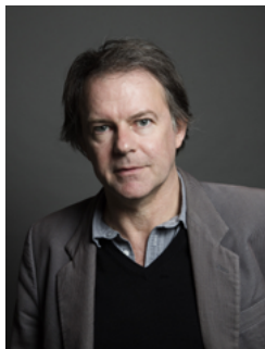
Maison Quinta Samedi 22 juin, 14h Discussion publique et signature

À l'occasion de la sortie de sa dernière publication, Yannick Haenel présente La Solitude Caravage (éd. Fayard) lors d'une discussion publique avec l'artiste Thomas Lévy-Lasne, suivie d'une signature.